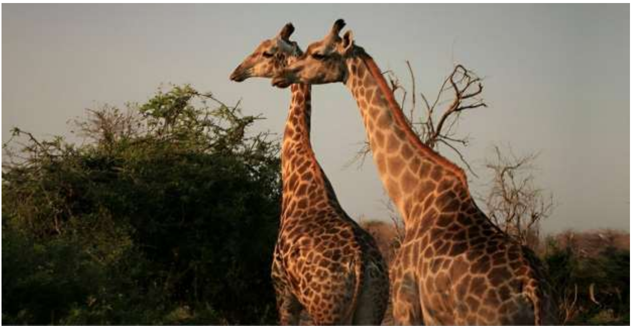
Жирафы парка Чобе. Октябрь 2022 г.

Проснувшись еще до восхода солнца, вы отправляетесь на уникальное сафари в Заповеднике Чобе. Почувствуйте, как просыпается Африка, как начинается день на самом загадочном континенте планеты.