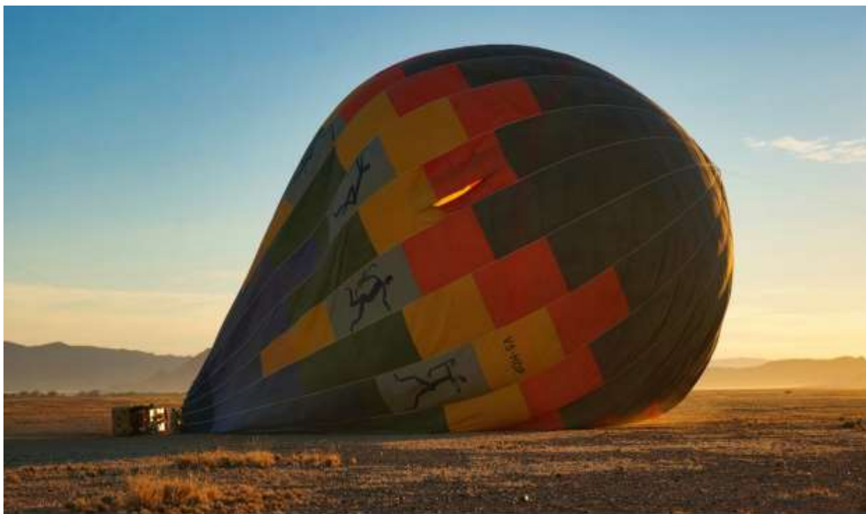
Подготовка к полету над пустыней. Март 2021 г.

Ранним утром полет на воздушном шаре . Захватывающий часовой полет над дюнами (при хороших погодных условиях) начнется на рассвете.