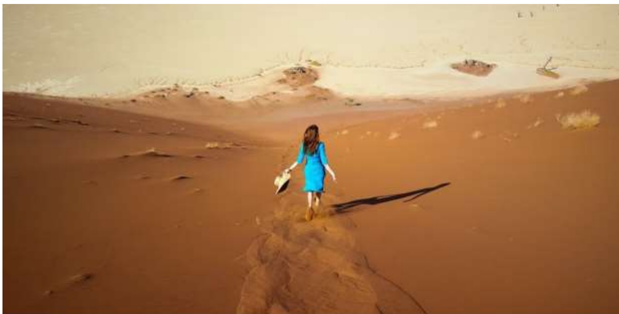
Спуск с дюны в Намибии. Декабрь 2021 г.

В этот день вас ждет поездка в дюны , красные и загадочные, освещенные первыми лучами восходящего солнца. Вы посетите «Мертвую долину» и поднимитесь на дюны, с которых откроется сказочный вид пустыни.