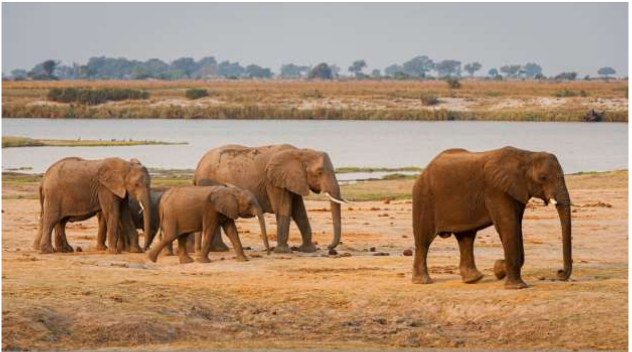
Слоны Ботсваны. Июль 2020 г.