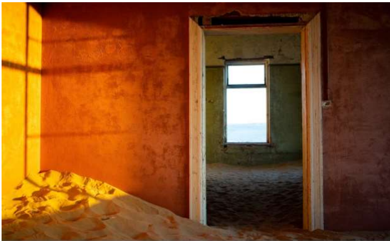
Дом, занесенный песками. Апрель 2020 г.

Фотографы со всего мира съезжаются сюда для топовых снимков.