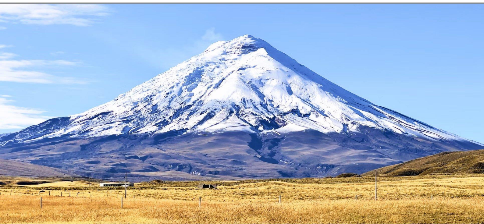
Величественный вулкан Котопахи.

Утром мы направимся в регион Котопахи , где сможем насладиться видами на магический вулкан, самый высокий (если измерять от центра Земли) в мире, в обворожительном окружении асьенды San Agustín de Callo .