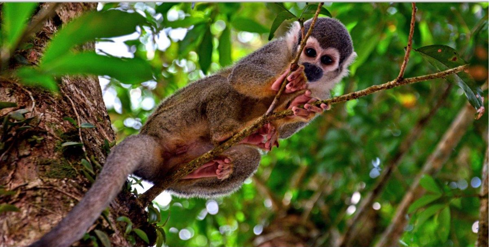
Беличья обезьяна (саймири) в эквадорской Амазонии.

Во второй половине дня мы посетим биологический заповедник Лимонкоча – удивительное место с множеством птиц и обезьян.