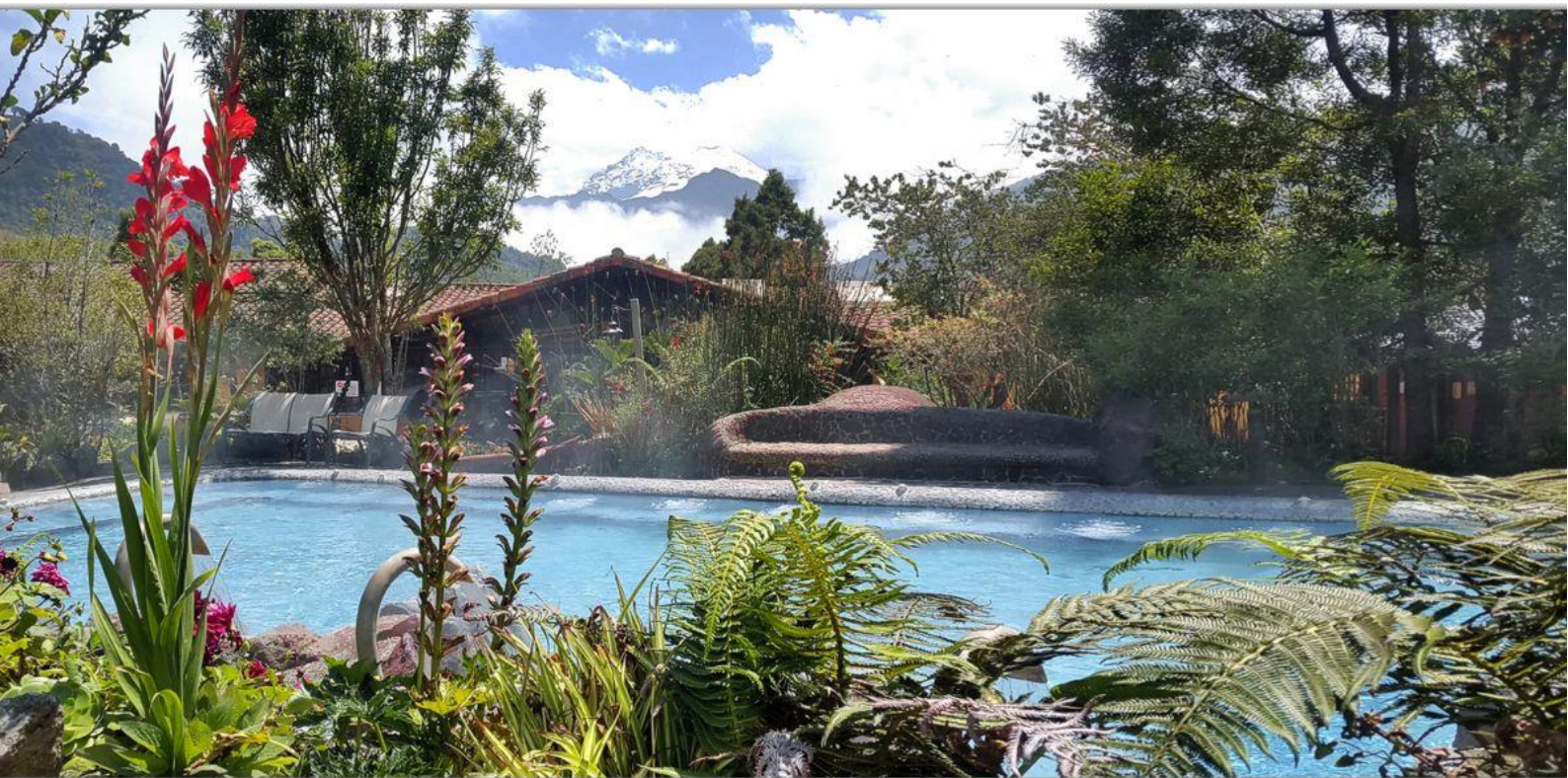
SPA-бассейн на курорте Папаякта.

Курорт Termas de Papallacta гарантирует своим посетителям здоровье, восстановление и отдых – три важных причины, чтобы посетить и насладиться окружающей средой, излучающей гармонию.