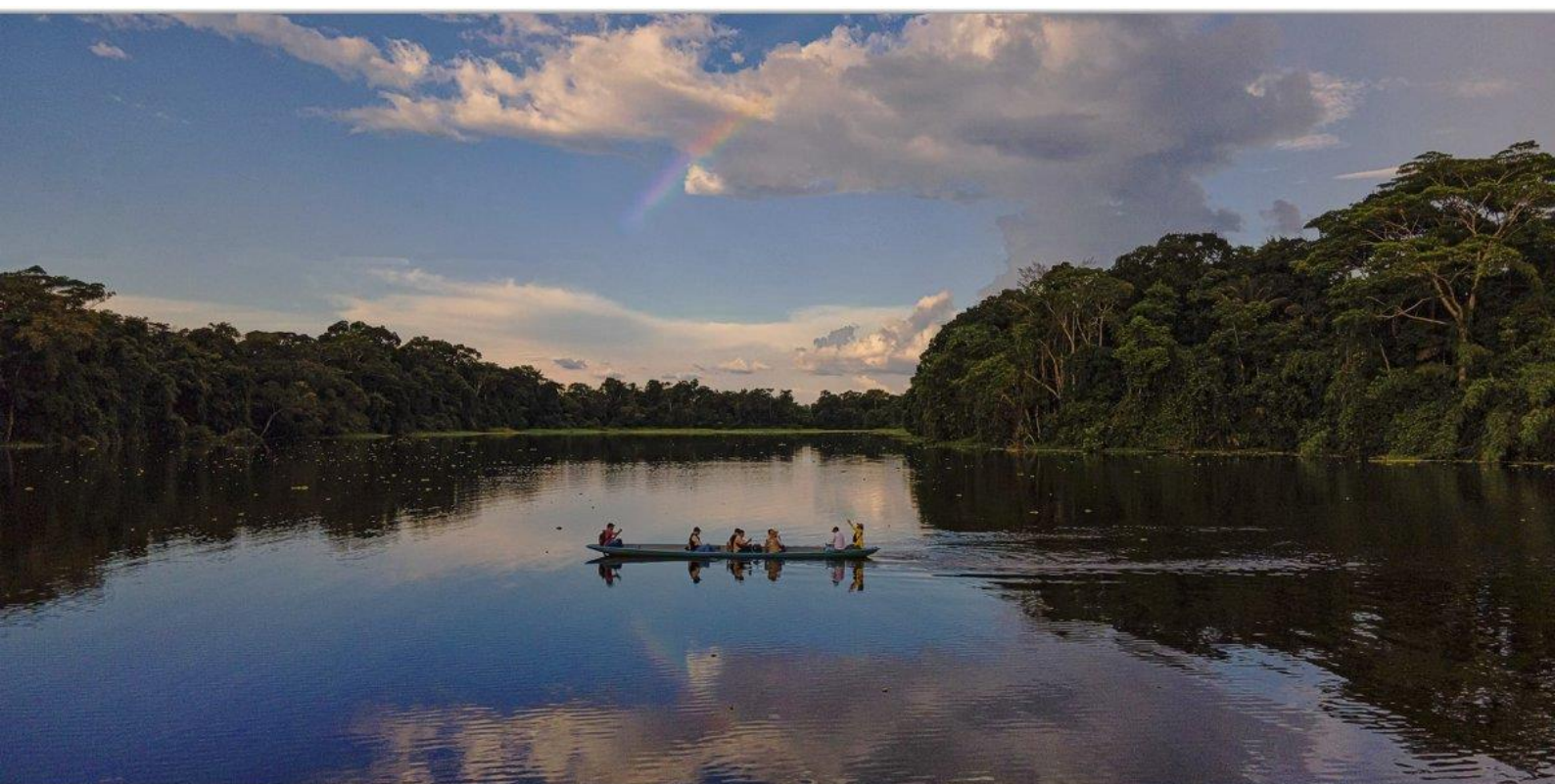
Радуга над тропическими лесами эквадорской Амазонии.

Во время вашей экспедиции по Амазонке насладитесь ежедневными утренними и вечерними экскурсиями и на каноэ, и по суше, увлекательными лекциями обо всем: от истории и культуры региона до птичьего, животного и растительного мира Амазонии. В самый жаркий полдень отдохните в общественных зонах или окунитесь в прекрасную атмосферу тропических лесов Амазонки.