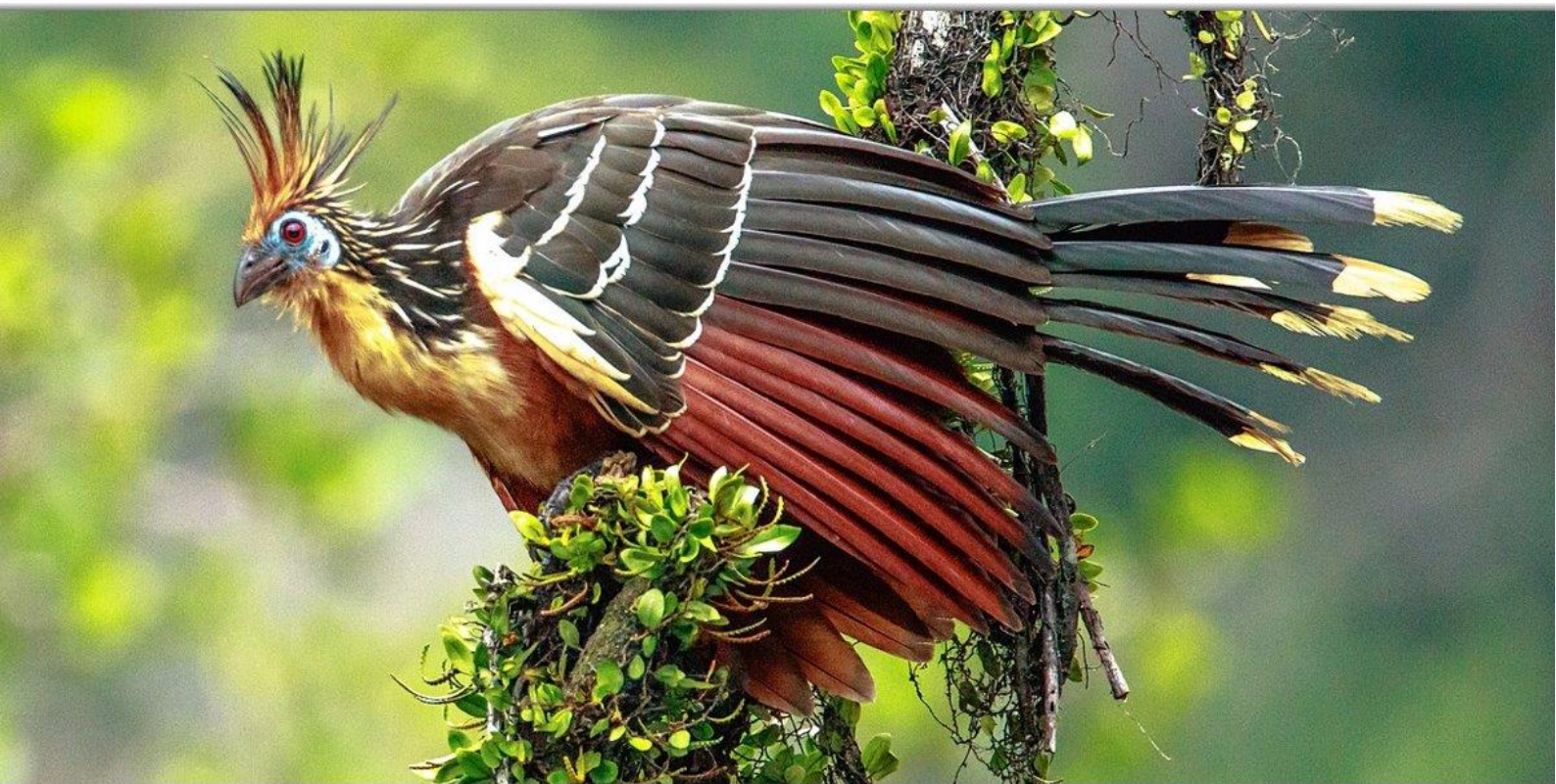
Гоацин на реке Напо в Эквадоре.

После обеда «Анаконда» продолжит свой путь к одной из самых древних систем темных вод бассейна реки Амазонки. Экосистема темных вод является средой обитания легендарных амазонских дельфинов, речных черепах, кайманов и загадочных амазонских ламантинов. Более того, если мы посмотрим на растительность по берегам, мы увидим рыжих ревунов и другие виды животных, таких как тамарин, беличья обезьяна, трехпалый ленивец, питающуюся листвой птицу, известную в народе по прозвищу «вонючая индейка» (гоацин) и др.