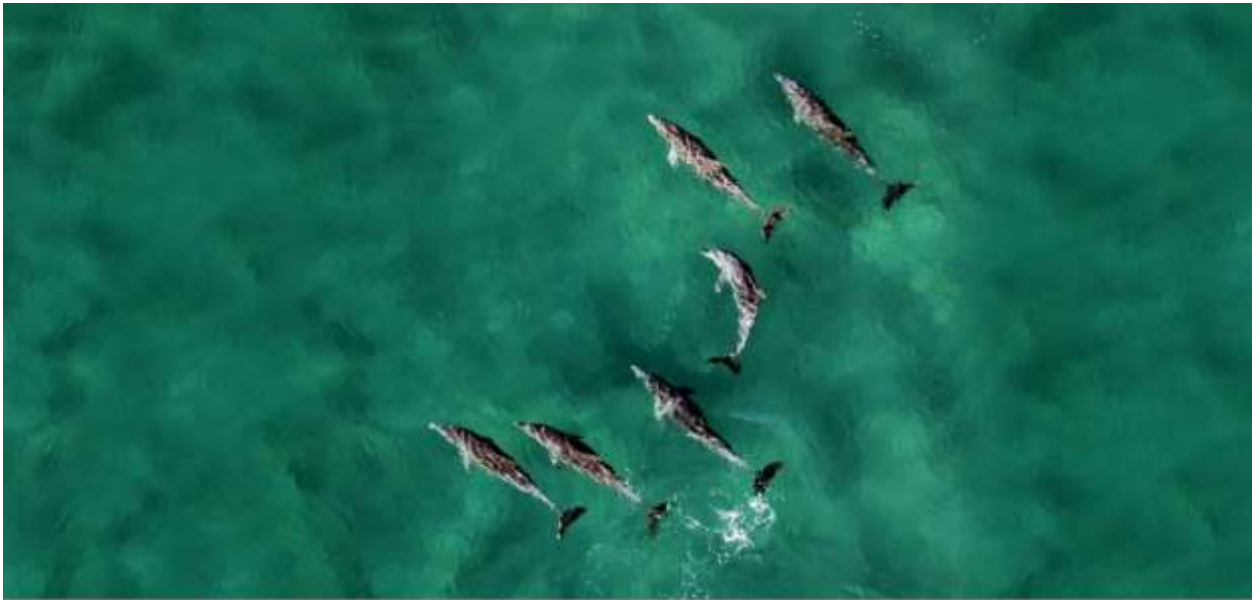
Дельфины в Мозамбике. Февраль 2018 г.

Наблюдения дельфинов здесь обычны, но, если вам повезет, могут появиться и находящиеся под угрозой исчезновения нежные гиганты – дюгоны.