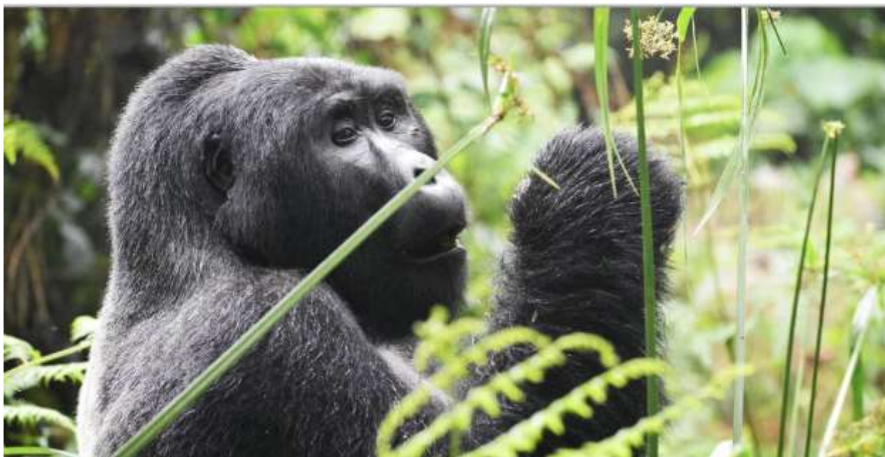
Самец горной гориллы в парке Вулканов, Руанда. Ноябрь 2022 г.

Во второй половине дня вас переведут в отель Kigali Serena .