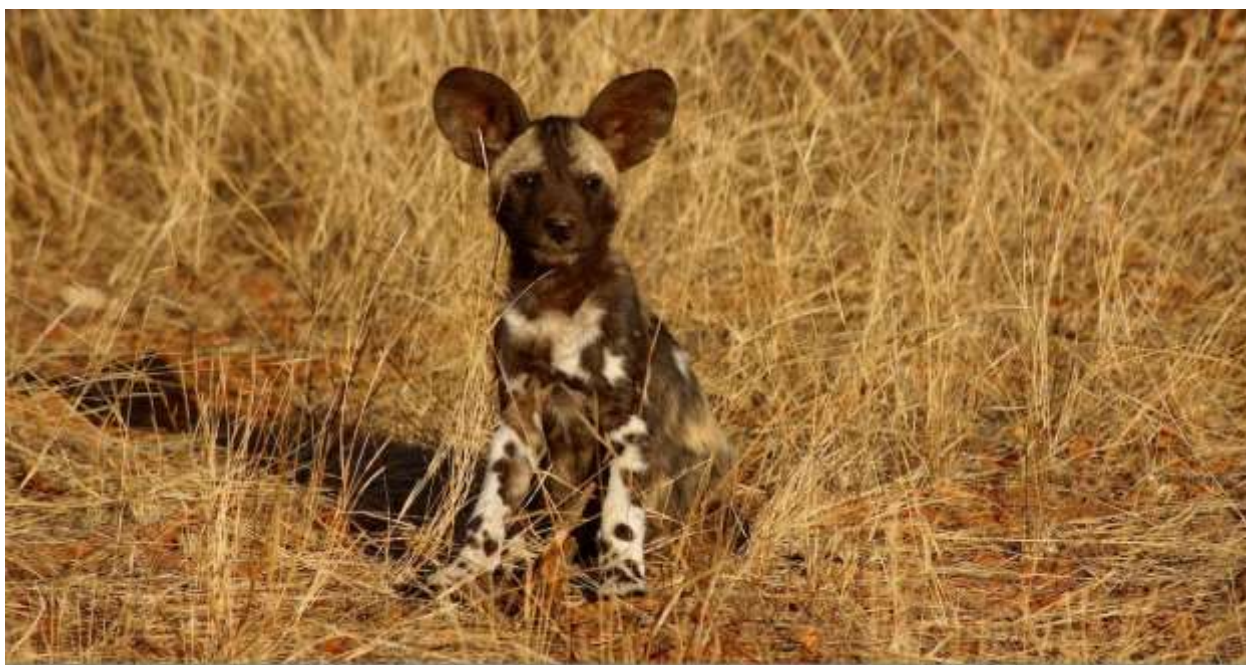
Щенок гиеновидной собаки, Ботсвана. Июнь 2021 г.

В первый же вечер вы отправитесь в частный круиз на лодке.