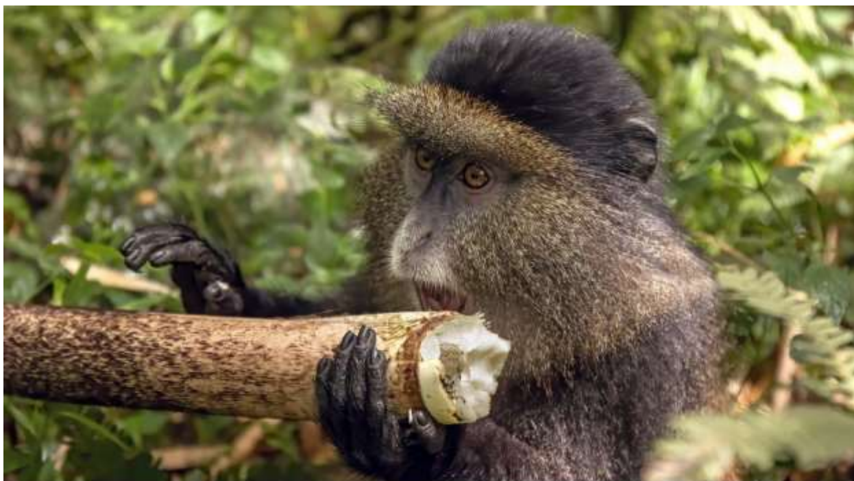
Золотая обезьяна за поеданием бамбука. Октябрь 2016 г. Автор фото: Charles J. Sharp. Лицензия: Creative Commons

После завтрака окунитесь в одно из уникальных впечатлений в Bisate Lodge , таких как поход за золотыми мартышками . Он начинается в штаб-квартире национального парка вулканов и ведет вас на поиски этого красиво окрашенного и увлекательного примата, который живет группами до 30 особей в бамбуковом лесу.