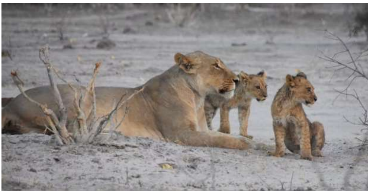
Львица с детенышами, Ботсвана. Декабрь 2020 г.

После завтрака все внимание направлено на поиск самой захватывающей дикой природы заповедника. Опытные профессиональные гиды ведут путь на джипах 4×4 Toyota Land Cruisers или пешком. Пешеходное сафари дает гостям возможность испытать Африку непосредственно с земли и насладиться близкими встречами с дикой природой, например, с гиеновидными собаками, львами и слонами.