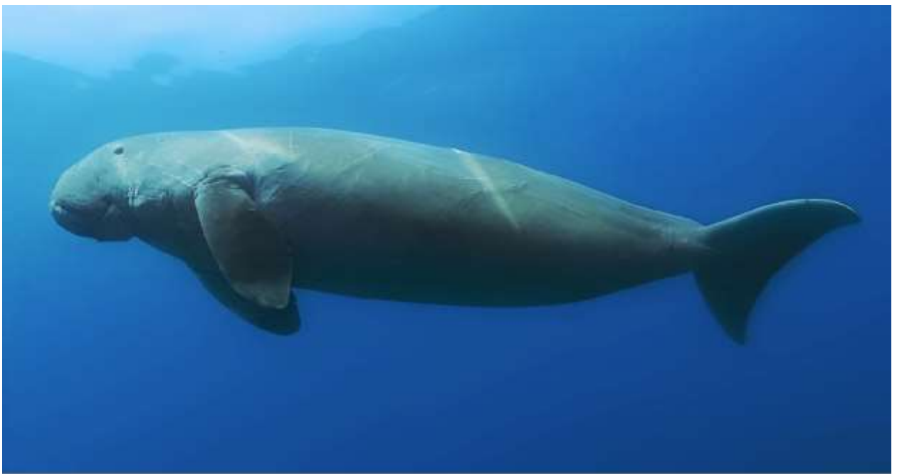
Дюгонь. Изображение в общественном достоянии

Наблюдения дельфинов здесь обычны, но, если вам повезет, могут появиться и находящиеся под угрозой исчезновения нежные гиганты – дюгоны.