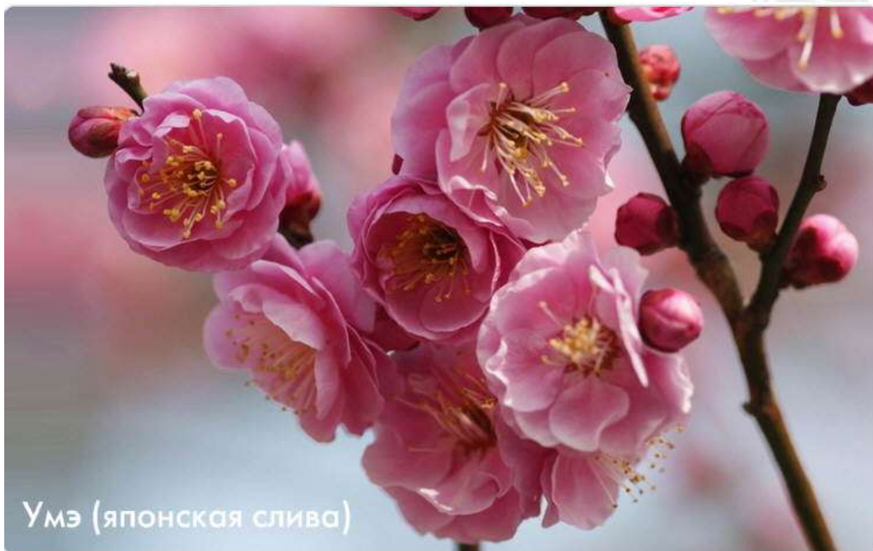
Умэ (японская слива)