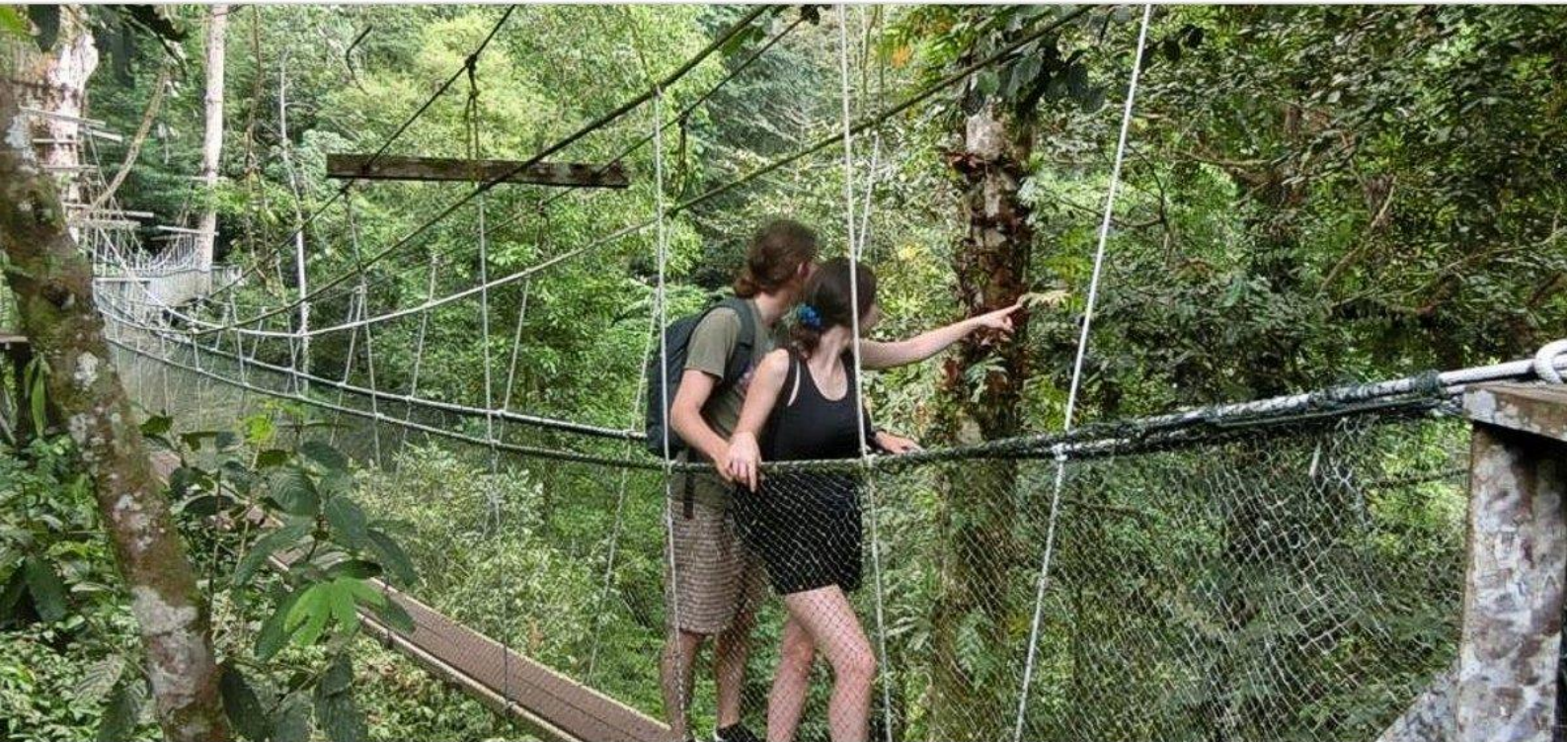
Подвесные мосты Mulu Сапору Skywalk.