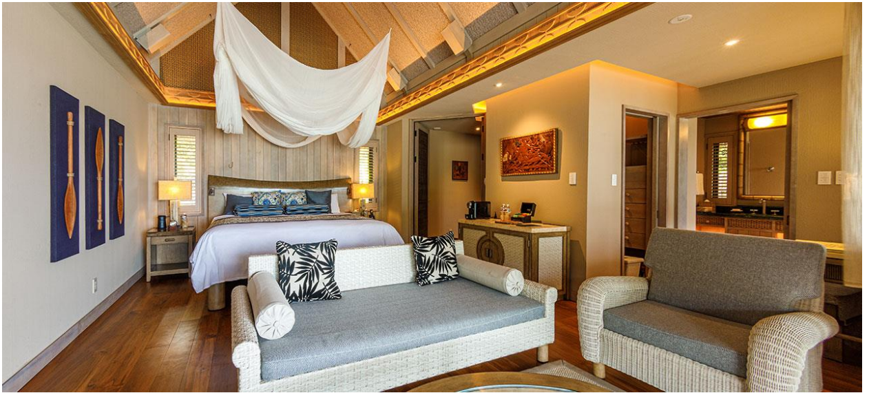
Lagoon View Pool Villa