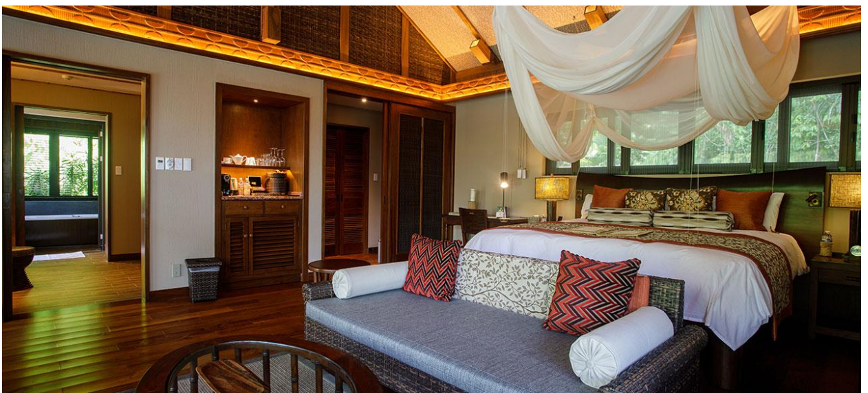
Pond View Pool Villa