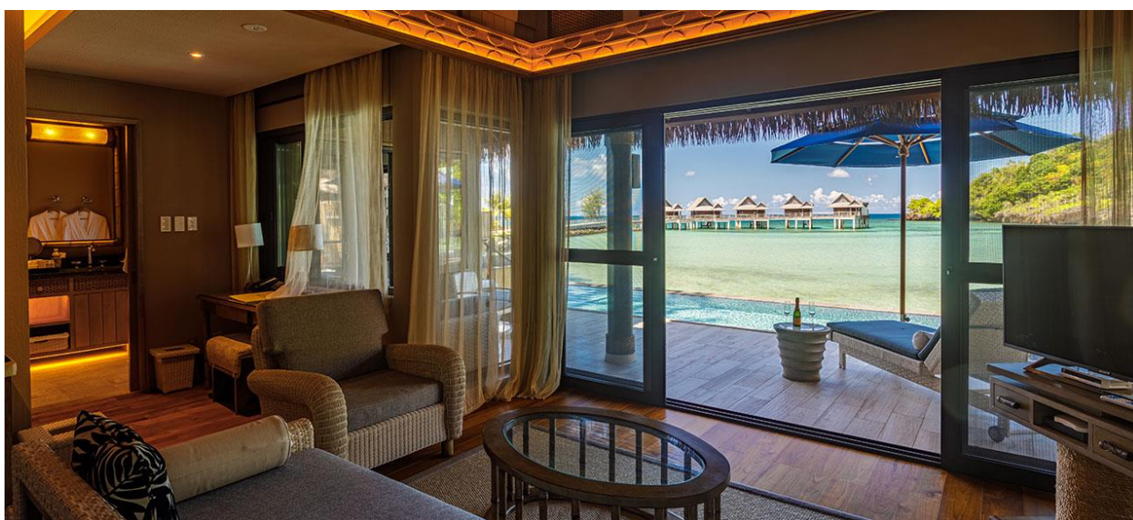
Lagoon View Pool Villa