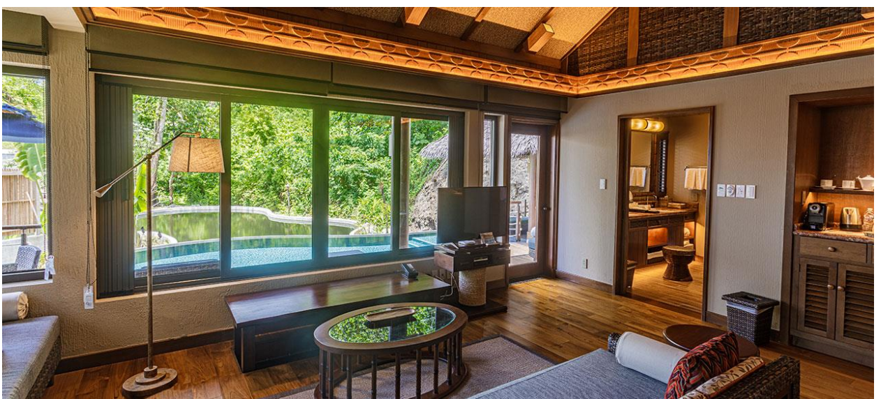
Pond View Pool Villa