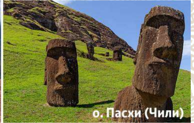
о. Пасхи (Чили)